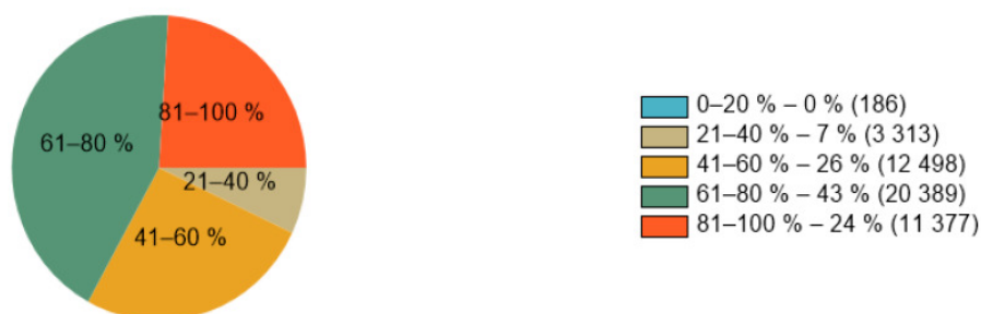
Tabulka detailních výsledků